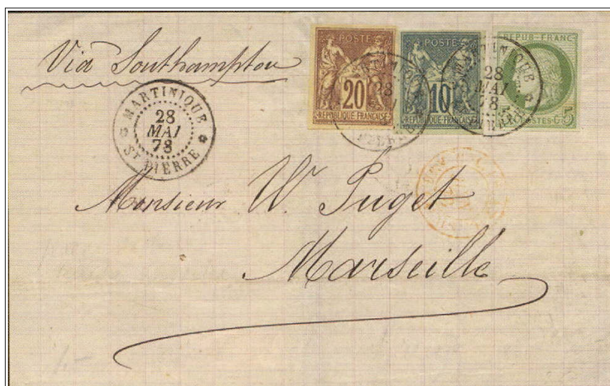
1878 (28 MAI) Brief bis 15 Gramm, MARTINIQUE (St. Pierre) - FRANKREICH. Leitweg: via Southampton nach Marseille. Portoberechnung: UPU-Rate 25 Centimen + 10 Ct. Seezuschlag. Total 35 Centimen, seltene Portoperiode von 1.5.1878-15.2.1879. (1)